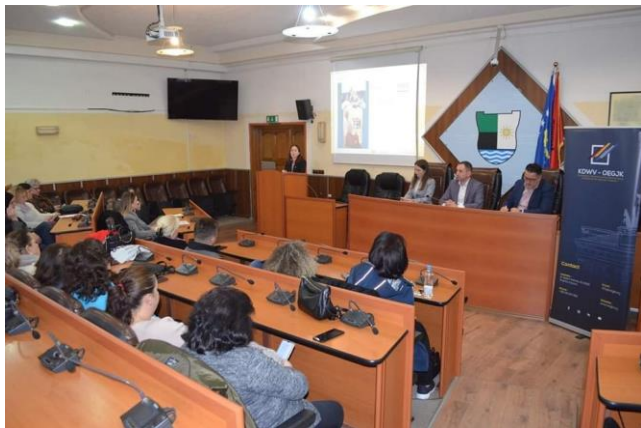
Fotografi nga Info Sesionin në Mitrovicë

Company representatives also had the opportunity to learn about the Senior Expert Service (SES) and the impact of engaging German experts and professionals in enhancing and expanding their activities.