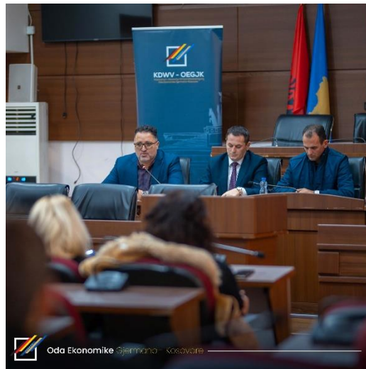
Fotografi nga Info Sესioni në Pejë