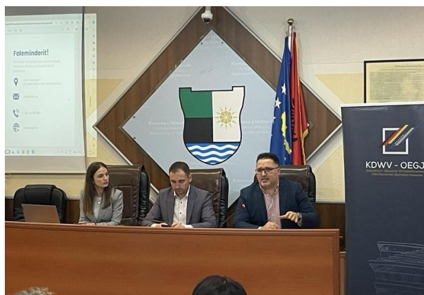
Photos from the Info Session in Mitrovica