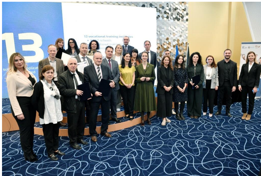
Fotografi nga Ceremonia e Ndarjes se Çmimeve

Innovation (MESTI), which is supported by an international consortium of consultants to implement the overall program.