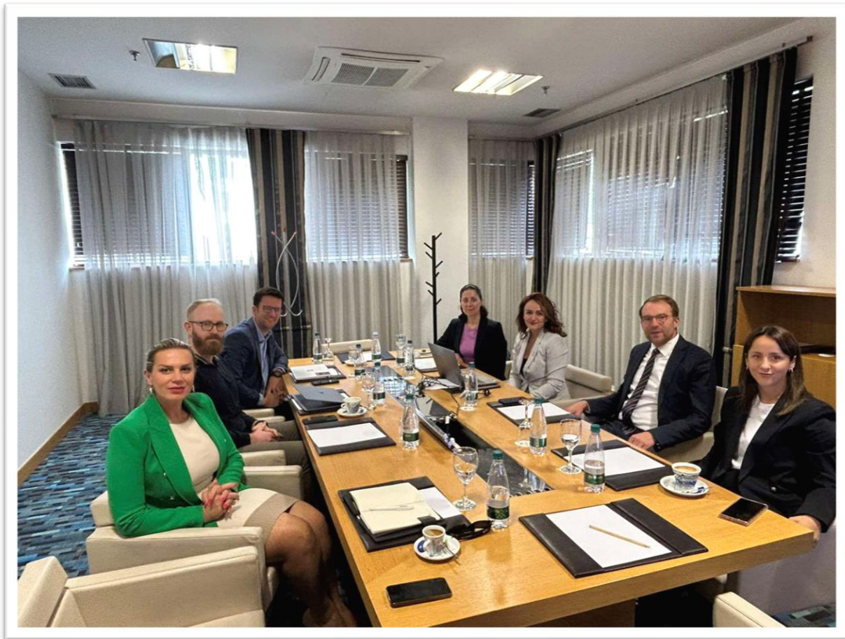
Fotografi nga Mbedhja e 49-të e Bordit të Odës Ekonomike Gjermano - Kosovare