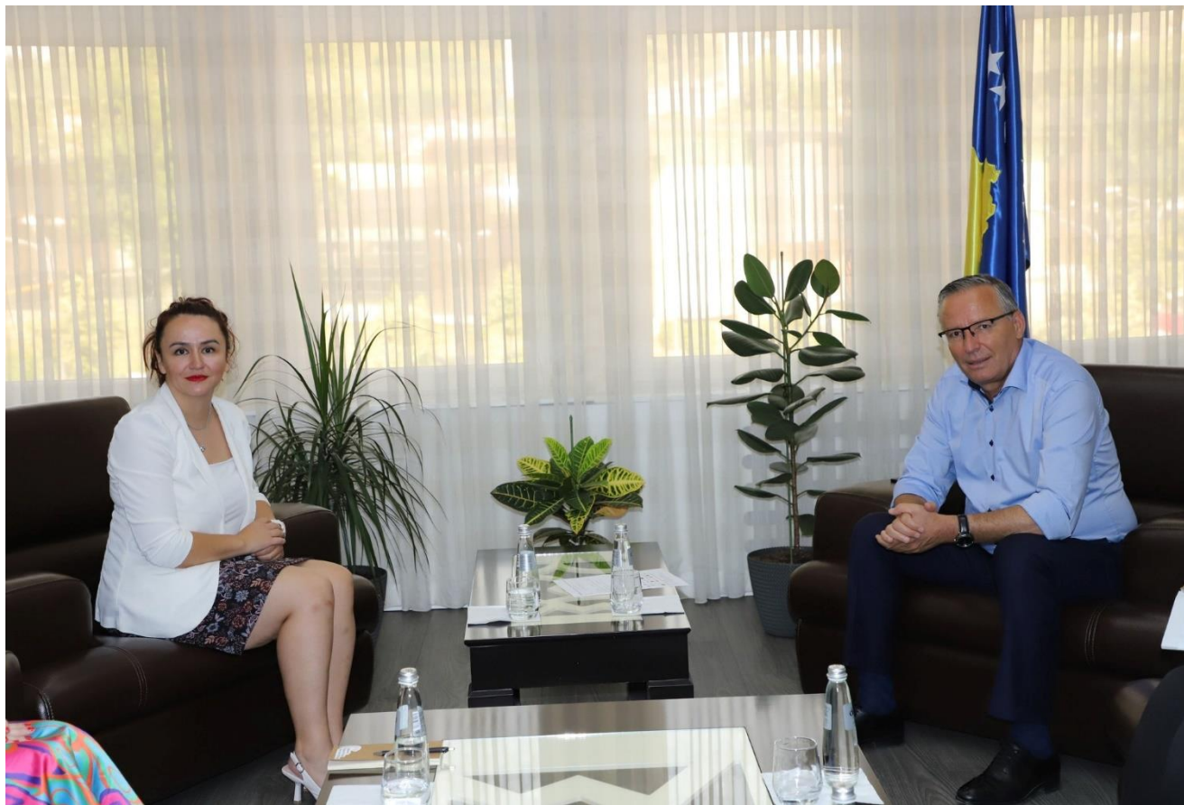
Drejtoresha Hasani vizitoi Komunën e Mitrovicës

In a very friendly conversation, we have encountered a willingness from the municipality from the outset to move forward together when needed.